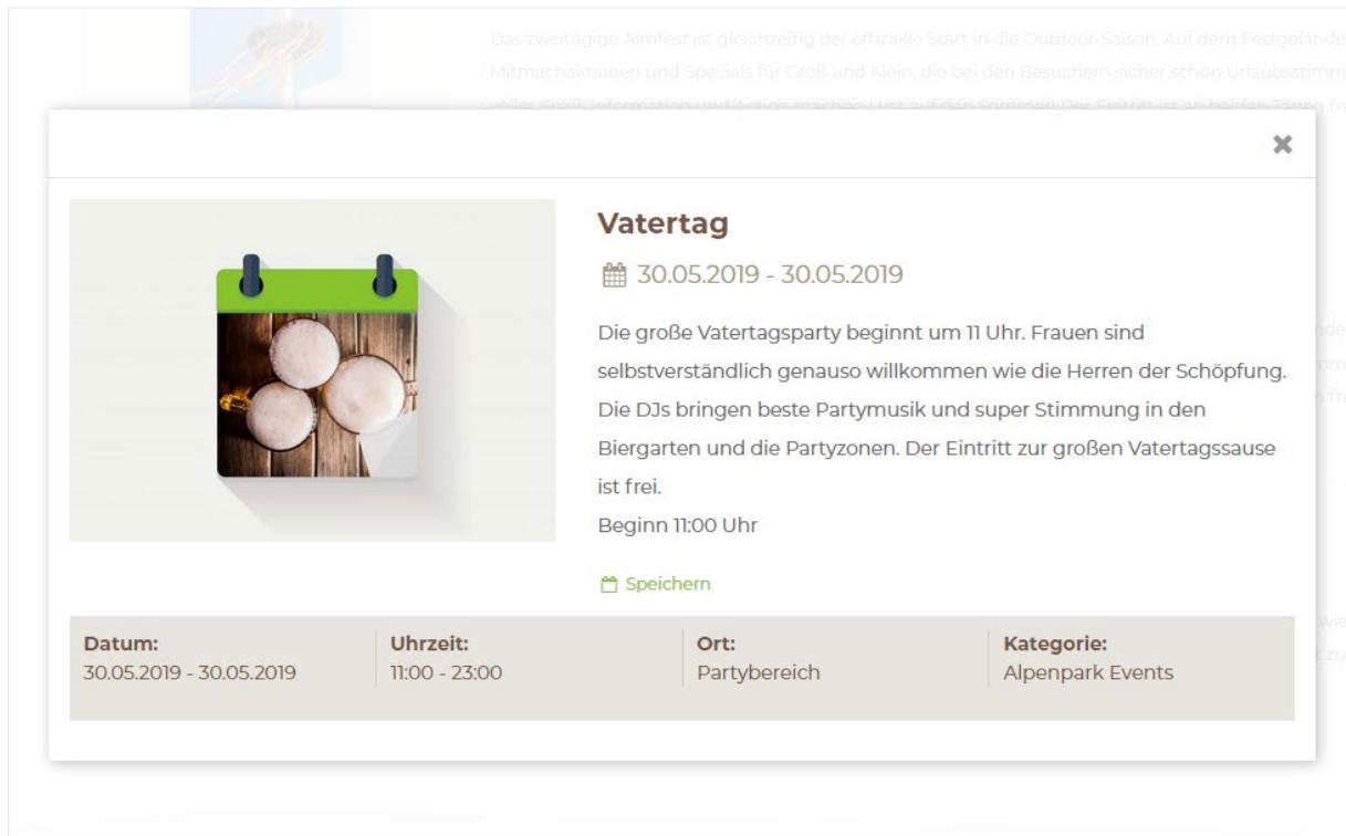
ABBILDUNG 3 -- HSEVENTS DETAILANSICHT / AM BEISPIEL DES ALPENPARK NEUSS

Veranstaltungen sind in diesem Fall als sogenannte „Kalenderanlässe“ in der Suite 8 definiert. Welche Anlassart (=Kategorie) ausgelesen werden soll, kann mit Hilfe der bereitgestellten Extension in TYPO3 direkt eingestellt werden. Damit wird es auch möglich, auf beliebigen Seiten Veranstaltungen unterschiedlicher Art/Kategorie einzubinden.